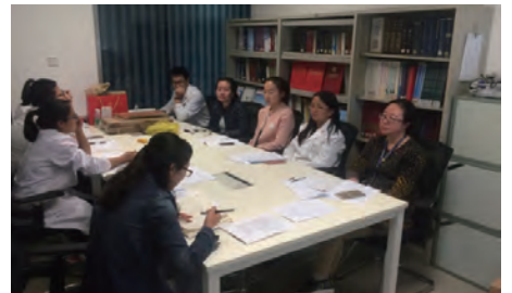
分析检测党支部组织学习《周恩来同志谈共产党员自我改造》