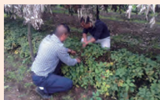
白药技术人员现场鉴定滇重楼种苗。

种苗供应之余，武定基地还向市场宣传云南白药滇重楼种苗标准，培训了从业人员，提高了相关人员辨识滇重楼种苗的能力。