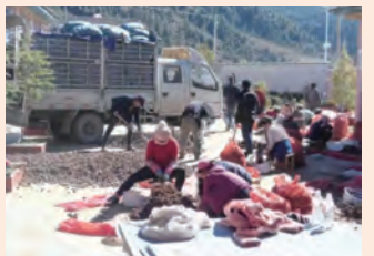
攀天阁乡药材采收、加工现场。

多年来，云南白药立足于中医药产业开展扶贫帮扶工作。在“挂包帮”“转走访”挂钩帮扶中，云南更将立足自身优势、整合市场资源，在全力打造中医药全产业链的过程中，积极探索并结合帮扶区域特质，集合季节特性，从种植源头开始严格把控，整合市场资源，打通产品销路，最终实现农民增收。