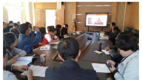
大理公司职能部门支部学习宣传的十八届六中全会精神