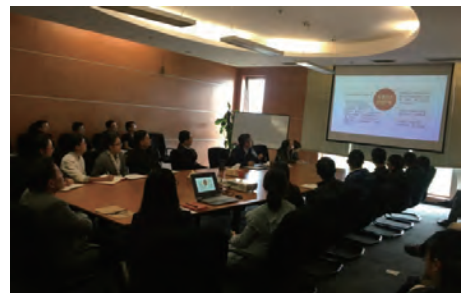
健康营销党支部学习六中全会精神，持续开展志愿者活动