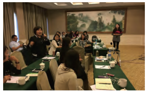
资产财务党支部开展“责任、担当、方法”党风廉政建设警示教育培训