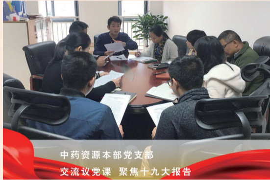
中药资源本部党支部 交流议党课 聚焦十九大报告

金秋十月，党的十九大召开之际，云南白药控股有限公司党委高度重视，组织党员、中层管理人员、部分职工群众和离退休老同志收听收看中国共产党第十九次全国代表大会，学习党的十九大报告要点。盛会期间，基层员工用不同的方式“对党说说心里话”。