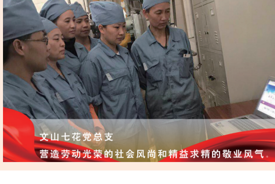
文山七花党支部 营造劳动光荣的社会风尚和精益求精的敬业风气