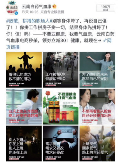
（药品事业部 市场推广部）

Better Nutrition (BN) 是美国最有权威性的第三方独立营养和健康杂志之一 (https://www.betternutrition.com)，已经开展了连续多年的、极具公信力的天然保