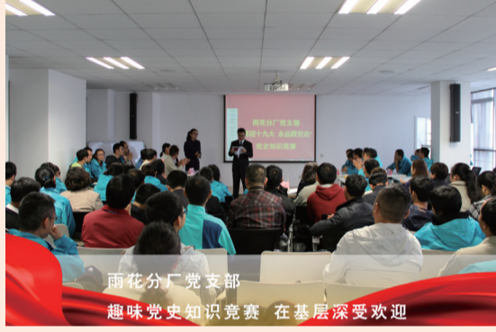
雨花分厂党支部 趣味党史知识竞赛 在基层深受欢迎