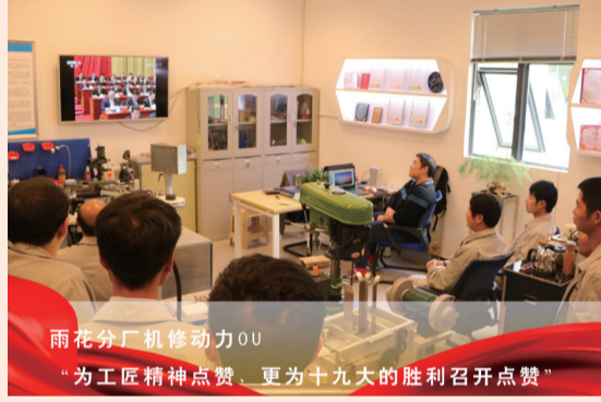
雨花分厂机修动力部 为工匠精点赞 更为十九大的胜利召开点赞