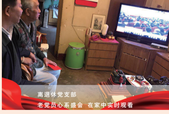
离退休党支部 老党员心系盛会 在家中实时观看