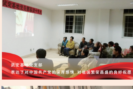
武定基地党支部 表达了对中国共产党的深厚感情 对祖国繁荣昌盛的良好祝愿